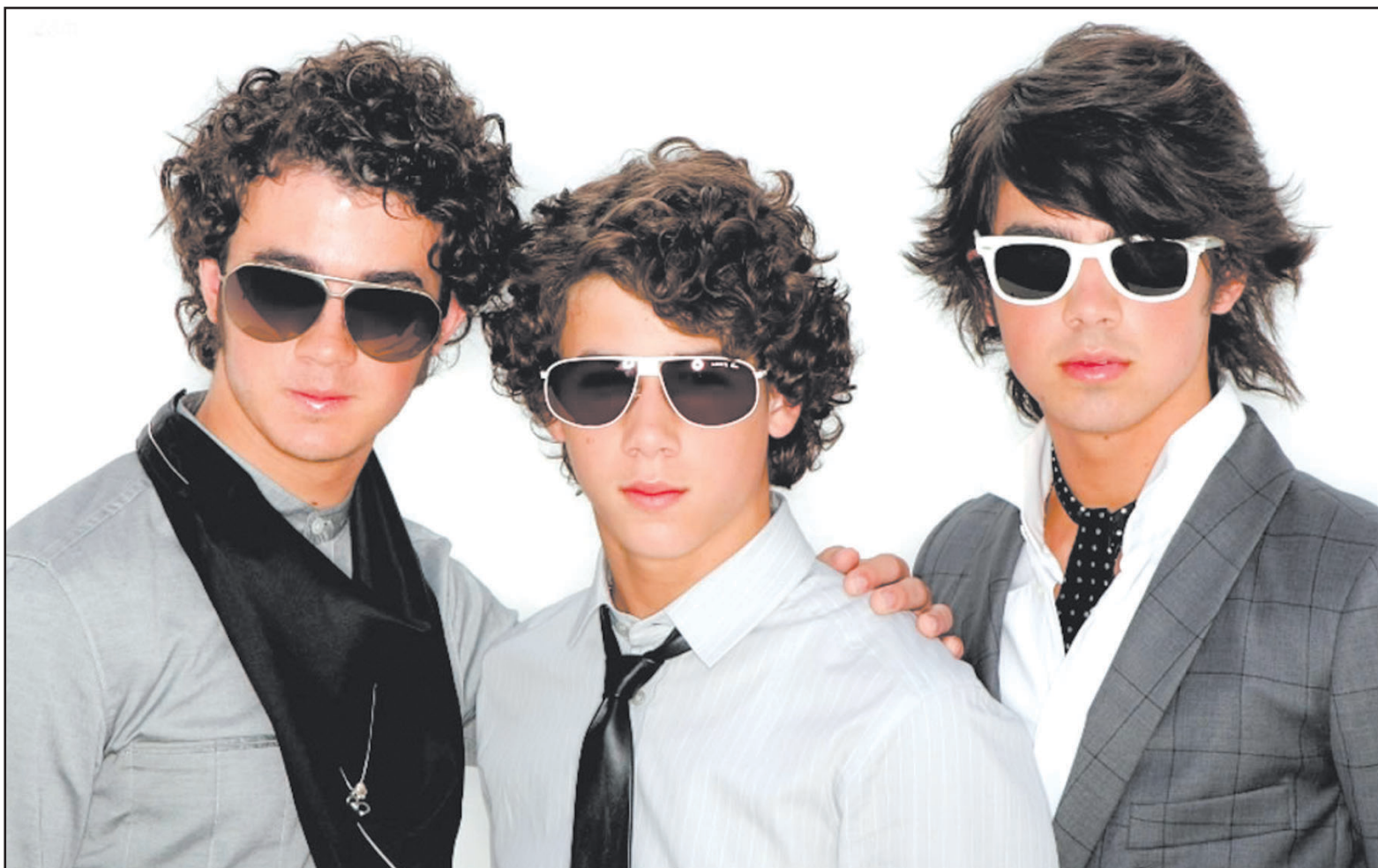
Kevin, Nick et Joe Jonas jouent une pop aux accents rock qui se veut inoffensive.

PHÉNOMÈNE TV, radio, concerts... impossible de passer à côté... Les Jonas Brothers, trois jeunes frères américains, ont pour vocation de convertir aux bonnes mœurs les ados du monde entier grâce à leur musique.